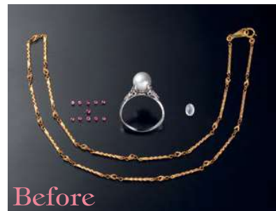
●ルビールース ●シルバーパールリング ●ムーンストーンルース ●K18ネックレス