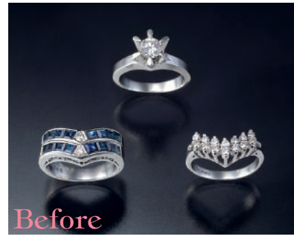
●Pt900立爪ダイヤモンドリング ●Pt900サファイア二文字Vリング ●Pt900ダイヤモンド二文字Vリング